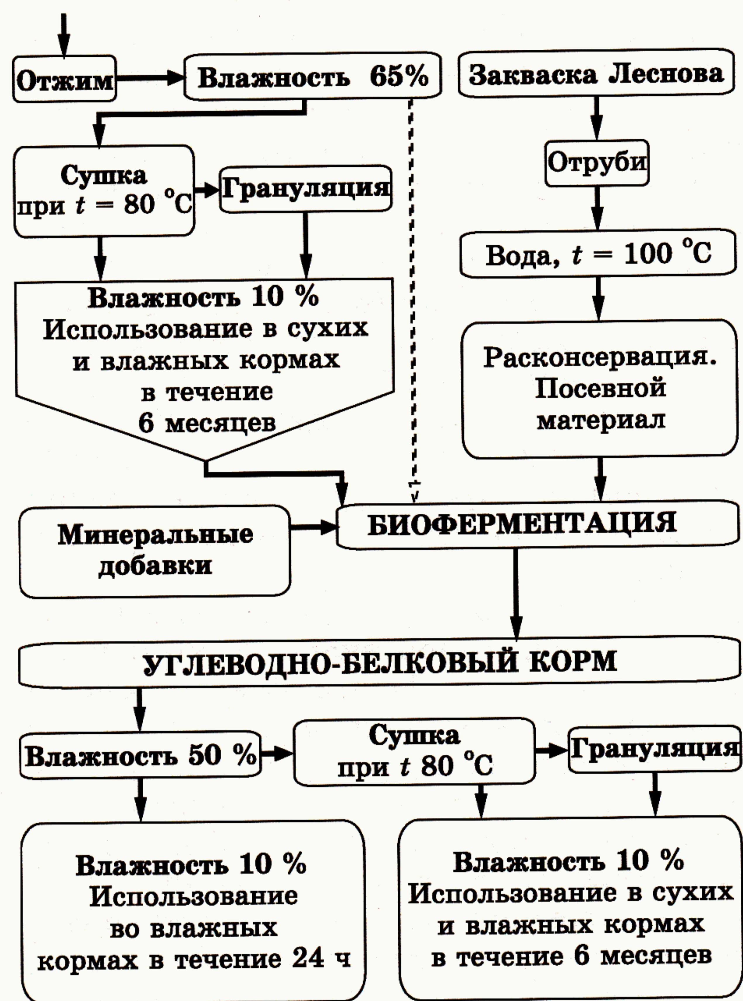
Рис. 1. Технология получения углеводно-белкового корма

биоферментации пивной дробины с помощью закваски Леснова по стадиям представлена на рис. 1.